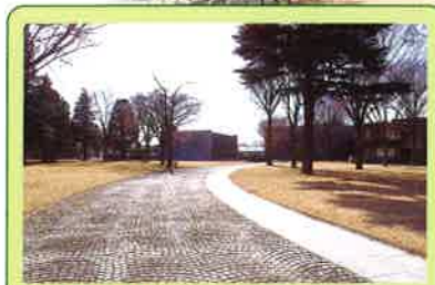
茨城県立歴史館(徒歩1分)

日本三名園の偕楽園まで徒歩5分。 周辺には、県立歴史館や 県立スポーツセンターなど、見どころや スポーツ施設がいっぱい！