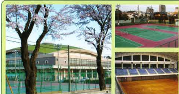
茨城県立スポーツセンター(徒歩5分)